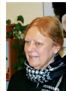
ředitelka Výboru dobré vůle – Nadace Olgy Havlové

Publikace je vydána v rámci osvětové kampaně Kroky k integraci, zaměřené na zpřístupnění škol a vzdělání lidem se zdravotním postižením