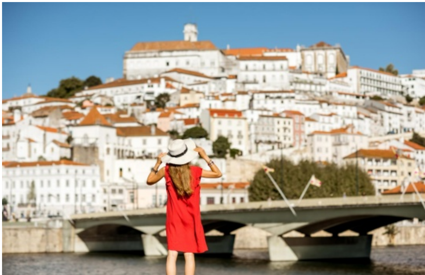
Portugalská Univerzita v Coimbre

Každá studentka/student Univerzity Karlovy má možnost v rámci svého studia vycestovat do zahraničí a sbírat zde další cenné zkušenosti. Studentům a studentkám se specifickými potřebami jsou nabízeny navíc některé služby, díky kterým bude jejich studium a pobyt na zahraniční vysoké škole přístupnější.